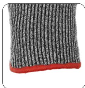
pružná manžeta pružná manžeta elastic cuff mankiet elastyczny